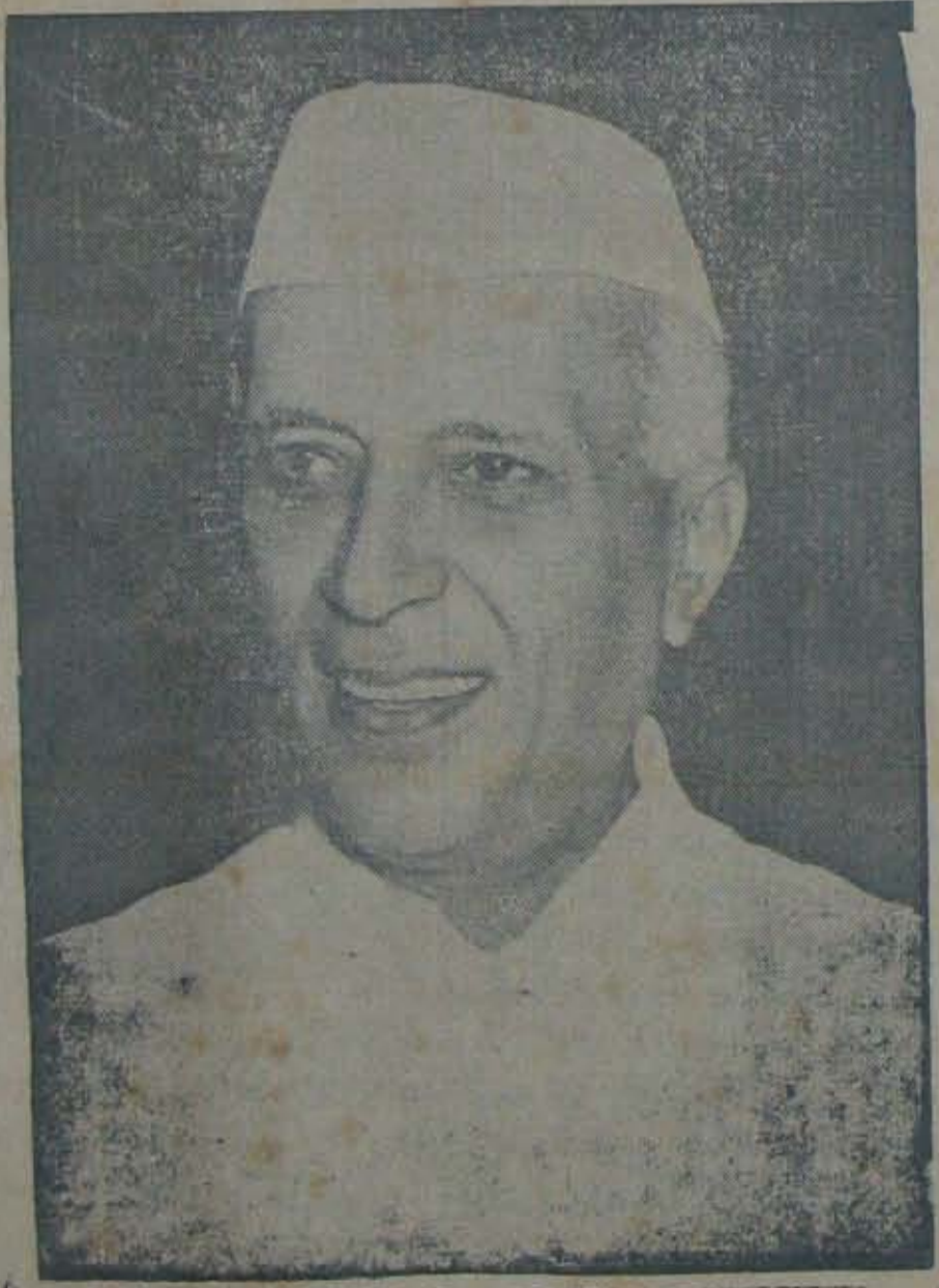
ఆంధ్ర రాజకీయ మహాసభలను ప్రారంభించిన ప్రధాని పండిట్ బవహర్లాల్ నెహ్రూ

★ ఆపలు మహాసభ అధ్యక్షతకు సంజీవరెడ్డి గారికి పేరు, ఒక నిర్దిష్ట ఏర్పాటు ప్రకారం, జిల్లా కాంగ్రెసు సంఘాలు పరుసగా మారిన చదంలోనే ఏదో అపహాసకతోచింది. ప్రజా కాంగ్రెసు అధ్యక్షుడు వున్నాడు; ముఖ్యమంత్రి వున్నాడు; వ్యర్థవాయుకుడు ప్రకారం పం - కొరవ 5 కేటా