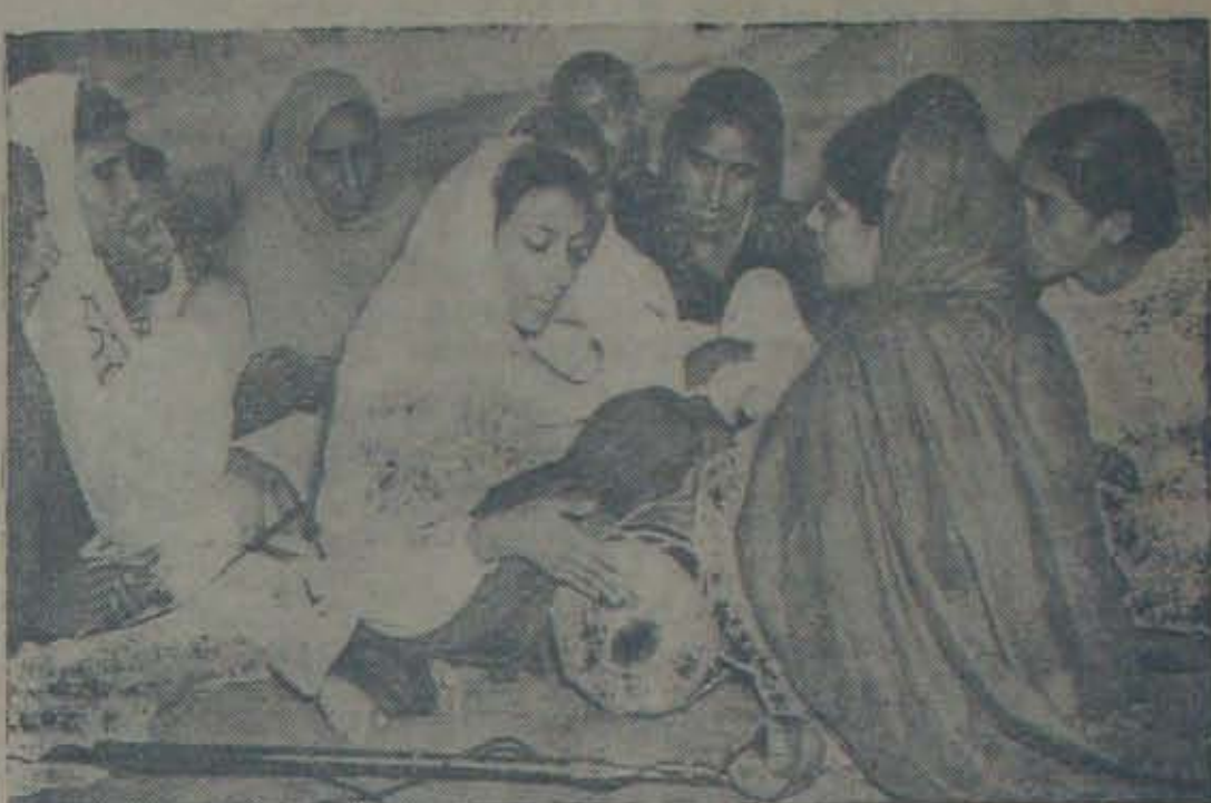
గ్రామాభ్యుదయ కార్యక్రమం ఐహముఖాలుగా చురుకుగా సాగిపోతున్నది. మహిళలలో ప్రబోధంగా వింది, గ్రామ ఆరోగ్యాన్ని కాపాడుటకు కొన్ని గానభ్యుదయ విద్యరచనలు ఉన్నాయి. అలాంటి ఒక బాసవద గానభ్యుదయి యా వితరంలో చూడవచ్చు.

ఈ వివాదం బొంబాయి హైకోర్టు క్రధాన న్యాయాధిపతి సి. చాగ్లా గారి విచారణకు వచ్చింది. చాగ్లా గారు ఆలోచించి ఈ సమస్యను న్యాయవాద నిర్ణయసంఘాని (బార్ కౌన్సిల్) కి పంపిరి. ఆ సంఘము సమాఖ్యలముగ తరలింది గొర్రా గారి క్రతర్తన కృత్రిమంబంధమైన దీక్షి