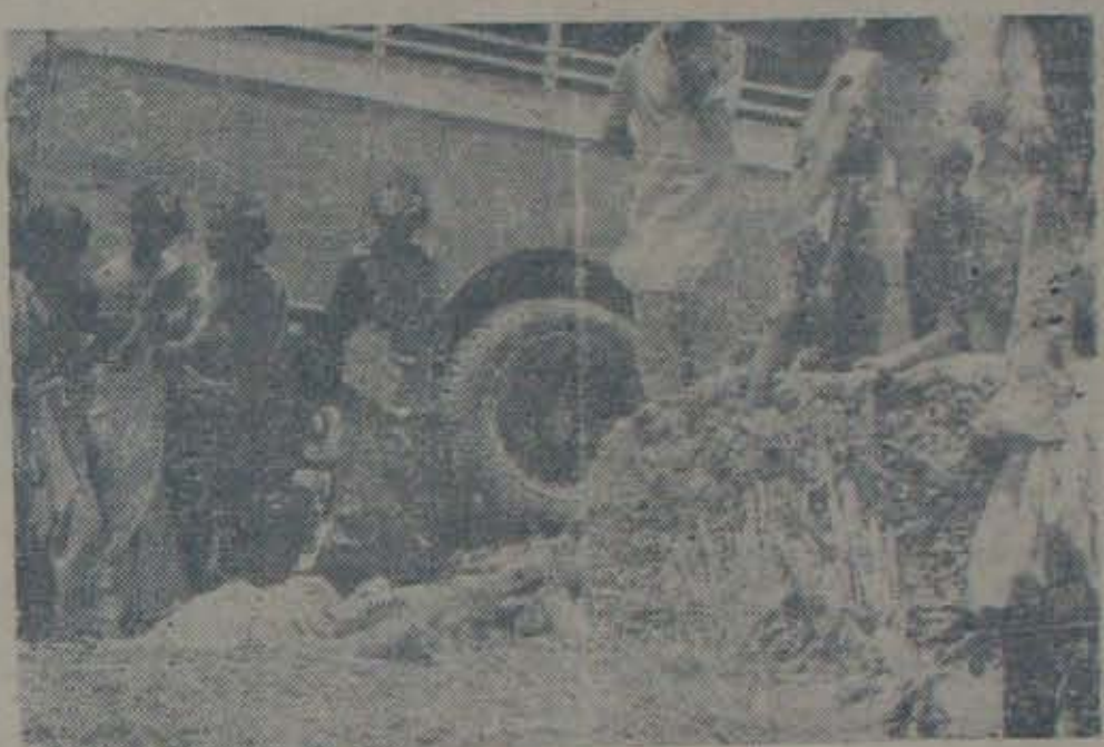
24 తేదీ నెల్లూరు సమీపంలో జరిగిన బస్ ప్రమాదం దృశ్యము. అచ్చట వెంటనే మరణించిన తలలు తేని రెండు శవాలను యిందుచూడవచ్చు.