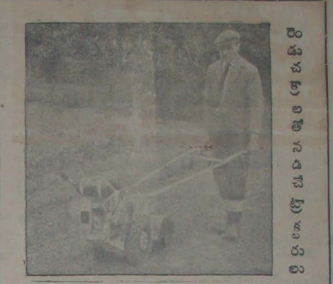
వ్యవసాయ రంగంలో అనుభవప్రాయోగకరమైన రెండుచక్రాల ట్రాక్టరు. ఇది యిటీవలనే విగ్రహంలో వుత్పత్తి చేయబడుతున్నది.

కొన్ని రాష్ట్రాలు కేంద్రంనుంచి సలహాలను నైతం స్వీకరించక కమిషన్ మొచ్చిన కృషిలో వ్యవసాయ రంగం మొదలు పెట్టాడు. పరిశోధనల విషయంలో ఒక ప్రాంతానికి మరొక ప్రాంతానికి సమన్వయం లేనందున కేవల మొత్తానికే వస్తుం సంభవించింది. ఈ నివేదిక ప్రయోజన కావడంతో, ఒక ఆధుల భారత సంస్థను నిర్మించాలన్న విషయంలో ఈ కమిషన్ చేసిన సిఫారసు చాలా అకా