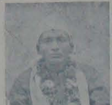
శ్రీ బత్తెన పెరుమాళ్లయ్య