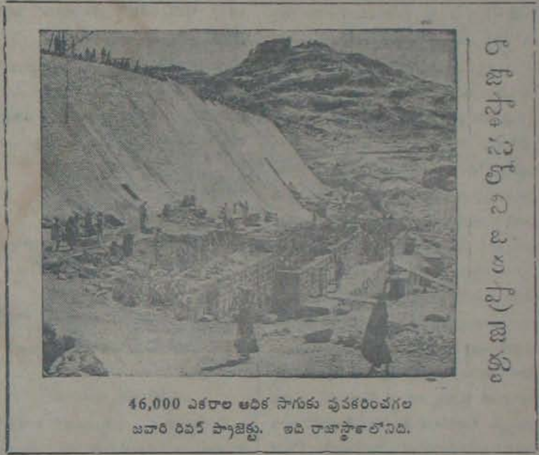
46,000 ఎకరాల ఆదిక సాగుకు వుపకరించగల జవారి రివర్ ప్యాజెక్టు. అది రాజాస్థానలోనిది.

మద్యనిషేధం విషయంలో ప్రతిపక్షాలకు మంత్రికే అంత వట్టింపు లేదనే విషయం రాకు మార్తి కమిటి నియామకమే మనకు చెప్తుంది. ఆ తర్వాత ఆయన కొంత వట్టింపు చూచాడు.