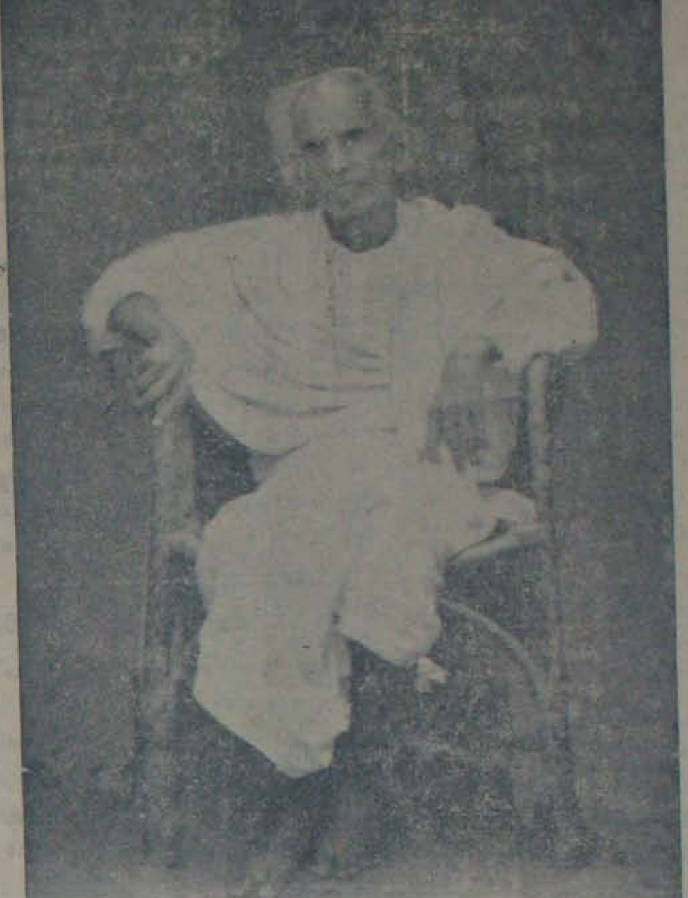
రాష్ట్రోద్యమ పితామహుడు దేశభక్త కొండా వెంకటకృష్ణయ్య పంతులుగారు