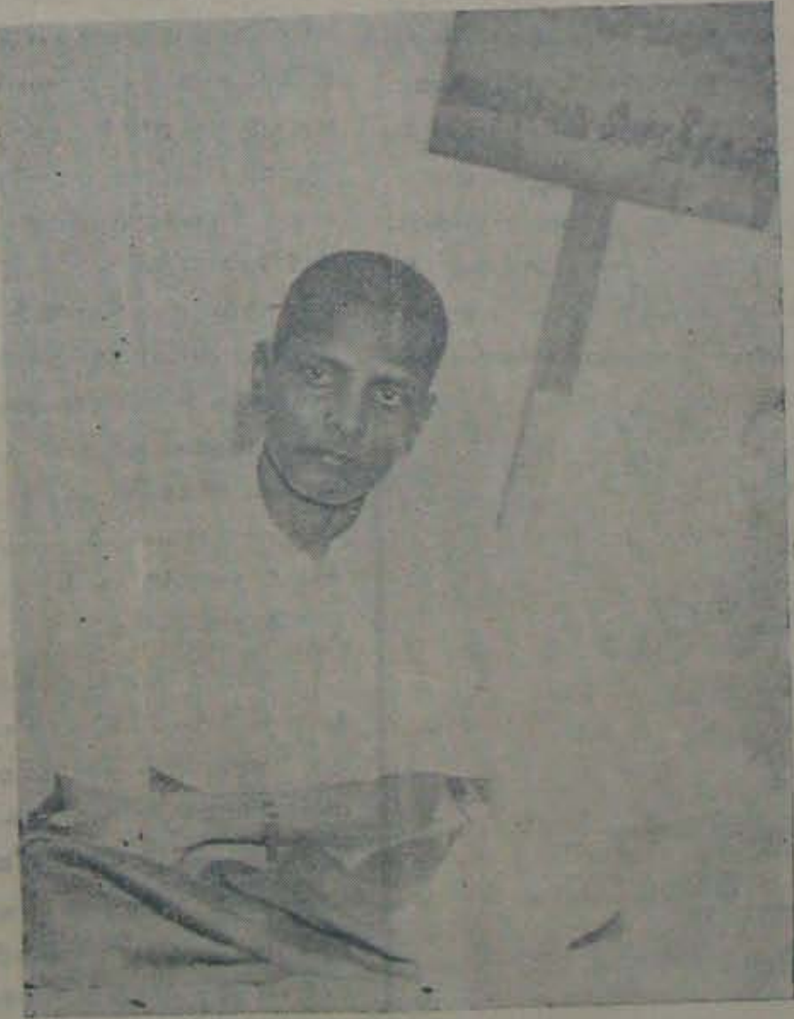
రాష్ట్రసాధనకు అత్యున్నతంగా వుంచిన మహాతపస్వి శ్రీ పొట్టి శ్రీరాములు