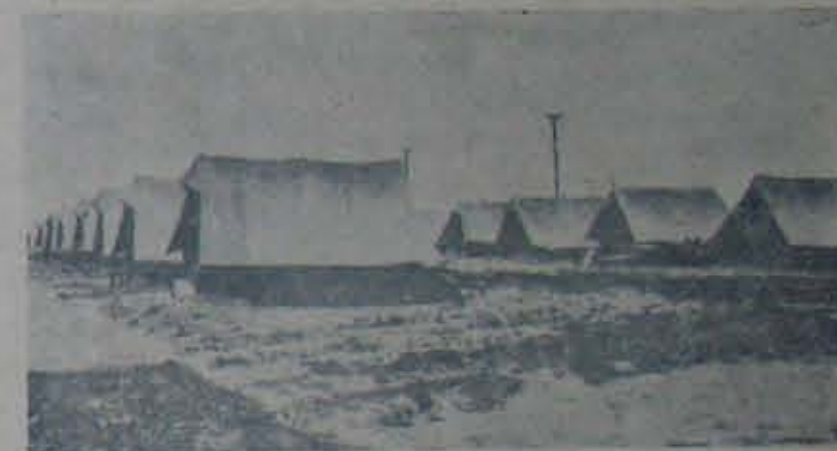
ప్రభుత్వేవ్వేగురుకుగా నిర్మింపబడ్డ గుడారాలు

ప్రతిస్థానముననుసరించి. అట్లే పాఠ్యమును అభ్య