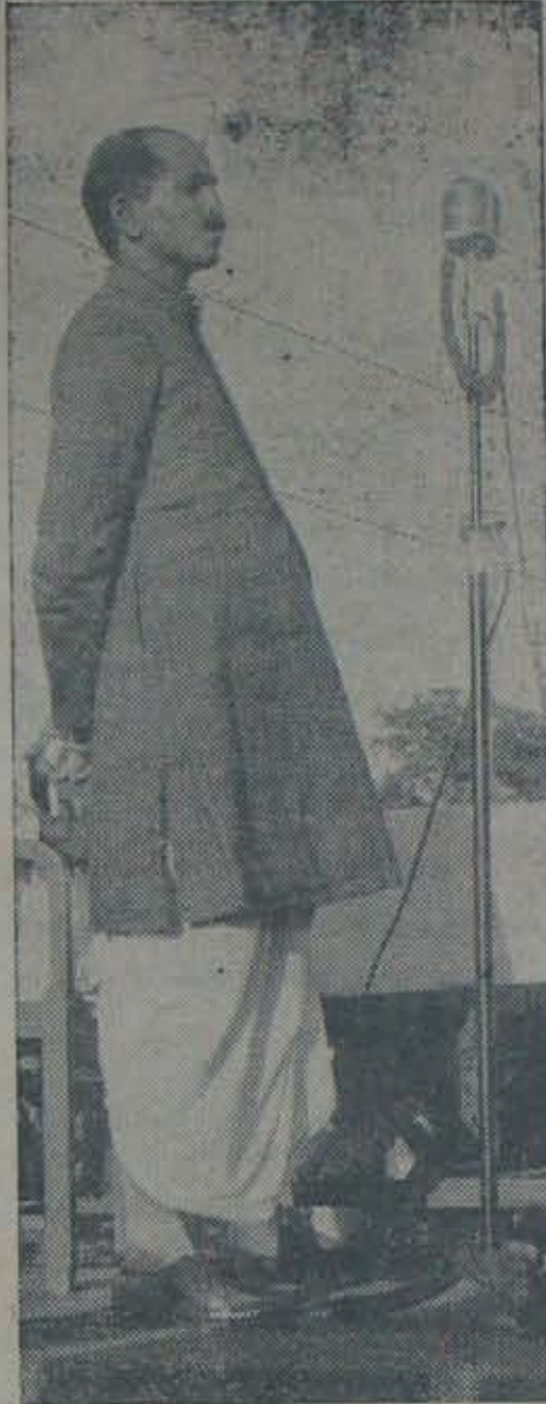
బలమునో సగి, సుక్రమ పరిపాలనా నిర్వహణకు కారకు లయ్యెదరనియు, ఆయురారోగ్యము లతో చాలకాలము తృణల క్షేమము లరయు

“ఏమి దీర్ఘ కాలము వడవిలోనుండి కొంత దెడిదిసనియును, శ్రీ రంగాగారు వడవికి రావలయు వడవికి వా కోరిక. ప్రజాస్వామ్య కక్షలకు