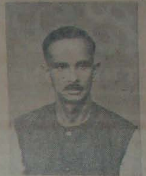
చేజర్ల పంచాయితీలో ప్రజలకు కమ్యూనిస్టునోడించి అభ్యర్థకుడయ్యాడు.