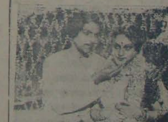
'ప్రపంచం'లో మొదటితరం దంపతులు!

"మమ్మకి కేసు, చేపికి నారం, అన్నయ్య కొరకే కారం" అన్న పాట నానికేనా? శి: కాదు ఆశ్రయింది.