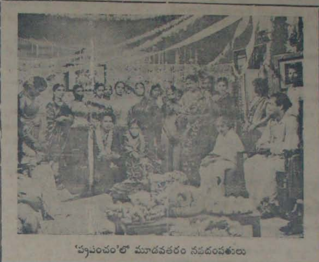
'ప్రపంచం'లో మూడవతరం నటదంపతులు

పక్ష ఇతివృత్తం కాదు. ఒక్కడక్కడ కాదు. తగిన పాత్రధారులుకూడా కావాలి. అనార్యుల సృష్టాన్ని డైరెక్టు చేయడానికి సరియైన కళాసంపత్తిగల దాన్ని డైరెక్టర్ వారకాలి. మొగల్ సామ్రాజ్య చైతన్యాన్ని చిత్రించగల అన్ని డైరెక్టర్లుండాలి. ముఖ్యంగా, 'అనార్యుల' పాత్రధారులకి లభ్యం కావాలి. ఇది చాలా కష్టసాధ్యమైంది. ఈ ఇతివృత్తాన్ని తీసుకొని, చిత్రవర్తనకుంటే, మరే ఇతర ఇతివృత్తాన్ని తీసుకొని చిత్రం తయారం చేయవలసింది - ఇది తలపెట్టిన ప్రబుద్ధులైన హెచ్చు రిస్తున్నాడు.