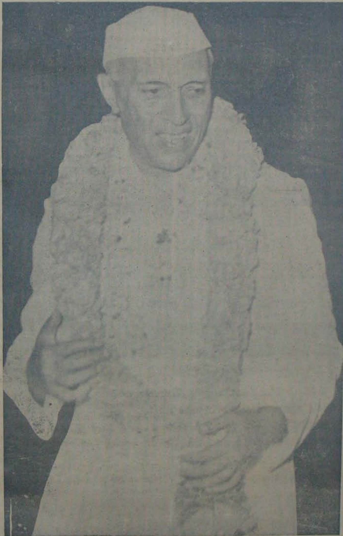
అరవసారి కాంగ్రెస్ అధ్యక్షుడుగా ఎన్నుకోబడి అఖండగౌరవాన్ని పొందిన నెహ్రూజీ