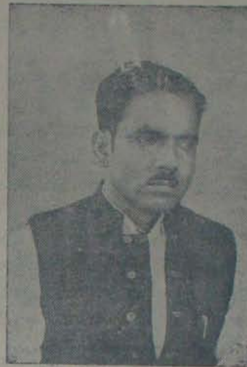
మహాసభను ప్రారంభించిన మంత్రి శ్రీ లచ్చన్న తిక్కలప్రకారం శాశ్వత జరాయితీపాత్రుల కోల్పోయిన రైతులకు ఆయాభూములను తిరిగి యిప్పించవలసిందిగా ప్రభుత్వమును మహాసభ వారు కోరుతున్నారు.

కుర్చ్యాన్ని మహాసభను వ్యవసాయకాఖా ముంది తీర్మానములను ప్రారంభించారు. ఇనాంగ్రెతుల మధ్యనుంచి తొనవచ్చినందున, చారిత్రాత్మికంగా ఆ సభలను సభి, వారివైపున కుంఠించినవారిని తన సహచరములతో సహజంగా సభించి, వారి యిట్లుబడిన