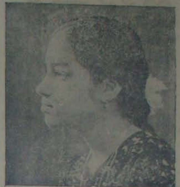
పద్మ: మధుర కంఠంతో ప్రేక్షకుల మెప్పుపొందిన చిరంజీవి. మంచి భవిష్యత్తువుంది!