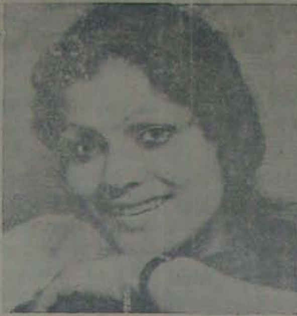
జయలక్ష్మి: ఈమె భరతనాట్యంకంటే గూడా, ఎంకిపాట ఎంత బాగున్నదన్నాడు ప్రేక్షకులు.