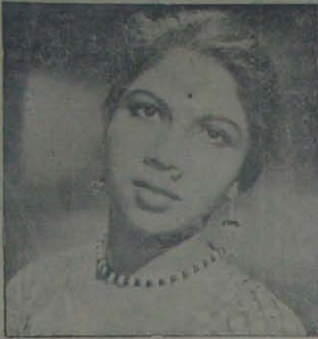
నీత్య: చిలిపిచెప్పలేగాదు చక్కని శాస్త్రీయ నృత్యాలగుడా చేయగలనని నిరూపించింది.