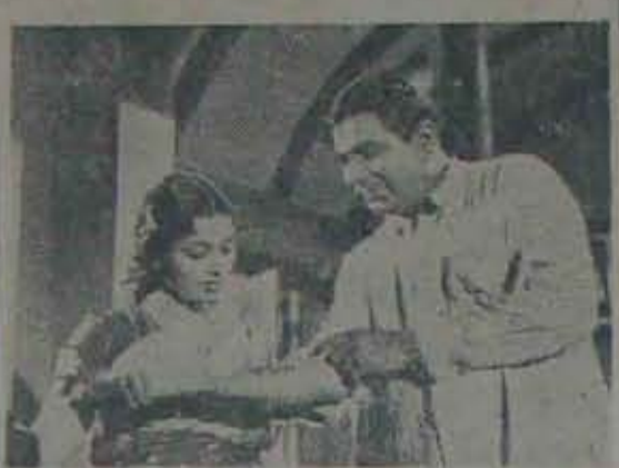
‘నాయిలు’లో కారద, శివరాములుగా రాజకుమారి, నాగయ్యగారలు

● రామకర్మ కాకాన్న రాదిగా తన బాధ్యతలు వెలిగాయనీ, తన క్యూర్ క్యూర్ ఇమెను దించిందినీ, డిహిస్తూ-తన బాబానాన్ని తెలుగు సినిమా సుందరమనీ తోచిస్తున్నాడని పొందీ లభాకు ప్రత్యేకచార్.