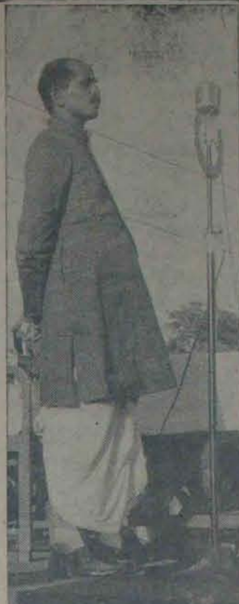
ప్రతిభామయి B. A. కి M. A. కి మార్గము వెళ్ళుచుండేవాడు.