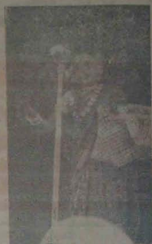
మద్యమంబో బరిగిన పిల్లల మహావలంకారంలో వివేక వేషంలో వున్న ఒక 'చిట్టమరదలు'