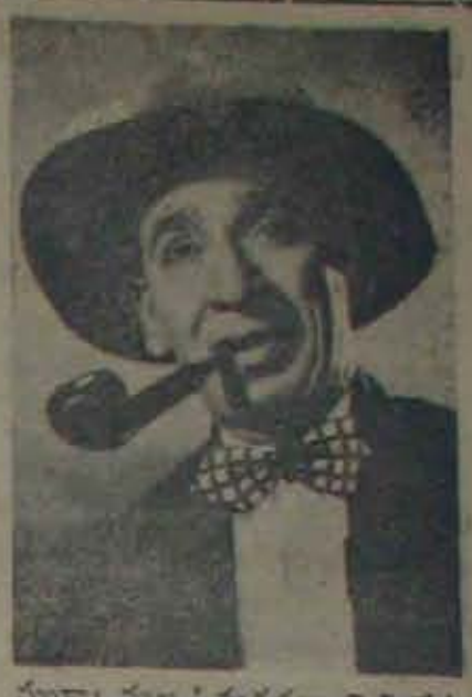
ముక్కామల 'మరదలు పెళ్లిలో' చిత్రంలోని వెంకట, డి. పి.

ఆశీర్వాదం ఎందరికీ కలిగి ఉంటుంది. అది మనకు నిలబడి ఉండేలా చేస్తుంది. అది మనకు నిలబడి ఉండేలా చేస్తుంది. అది మనకు నిలబడి ఉండేలా చేస్తుంది.