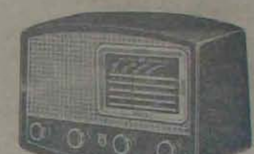
ప్రముఖ-మాడల్-146-5 వాల్చుల బ్యాండ్ ప్రైడ్ పి. సి. - నేపనల్ ఎకోవారి సుందరమైన రేడియో.