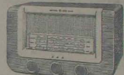
కుమార్-మాడల్-153-5 వాల్చుల పి. సి.-రేడియో చాల కక్కువలరీదు.