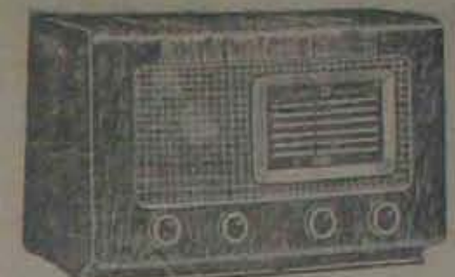
ప్రముఖ-మాడల్-154-5 వాల్చుల బ్యాండ్ ప్రైడ్ పి. సి. - నేపనల్ ఎకోవారి సుందరమైన రేడియో.

నేపనల్ ఎకో రేడియోలన్నీ మా చేత ఆధికారం పొందిన వ్యాపారుల ద్వారా మాత్రమే అమ్మబడుతాయి. ప్రతి రేడియోకీ గ్యారంటీ యిస్తాం.