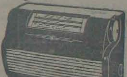
మాడల్-132-నేపనల్ ఎకో రేడియో వెల చాల వ్యర్థం. టైప్ బ్యాటరీ ఖర్చు తక్కువ. 4 వాల్చుల రేడియో 5 వాల్చుల కల్లము సొచ్చును.