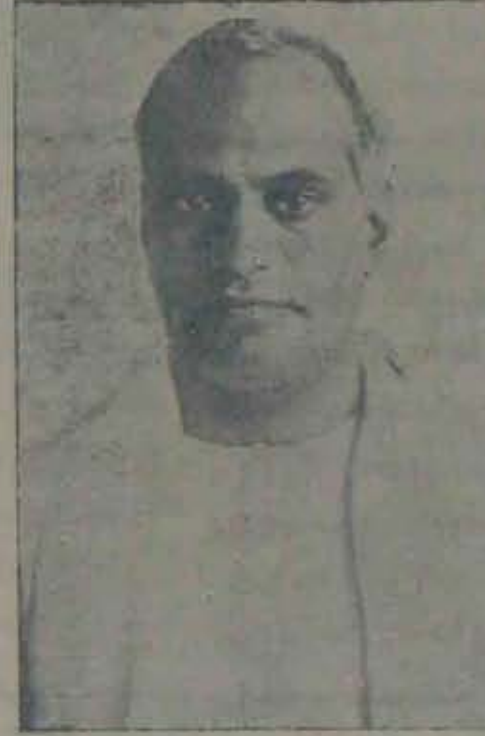
కర్మమంత్రి శ్రీ గి. ఇదివరలో ఎన్నడూ ఆంధ్రులకు చరగవటు