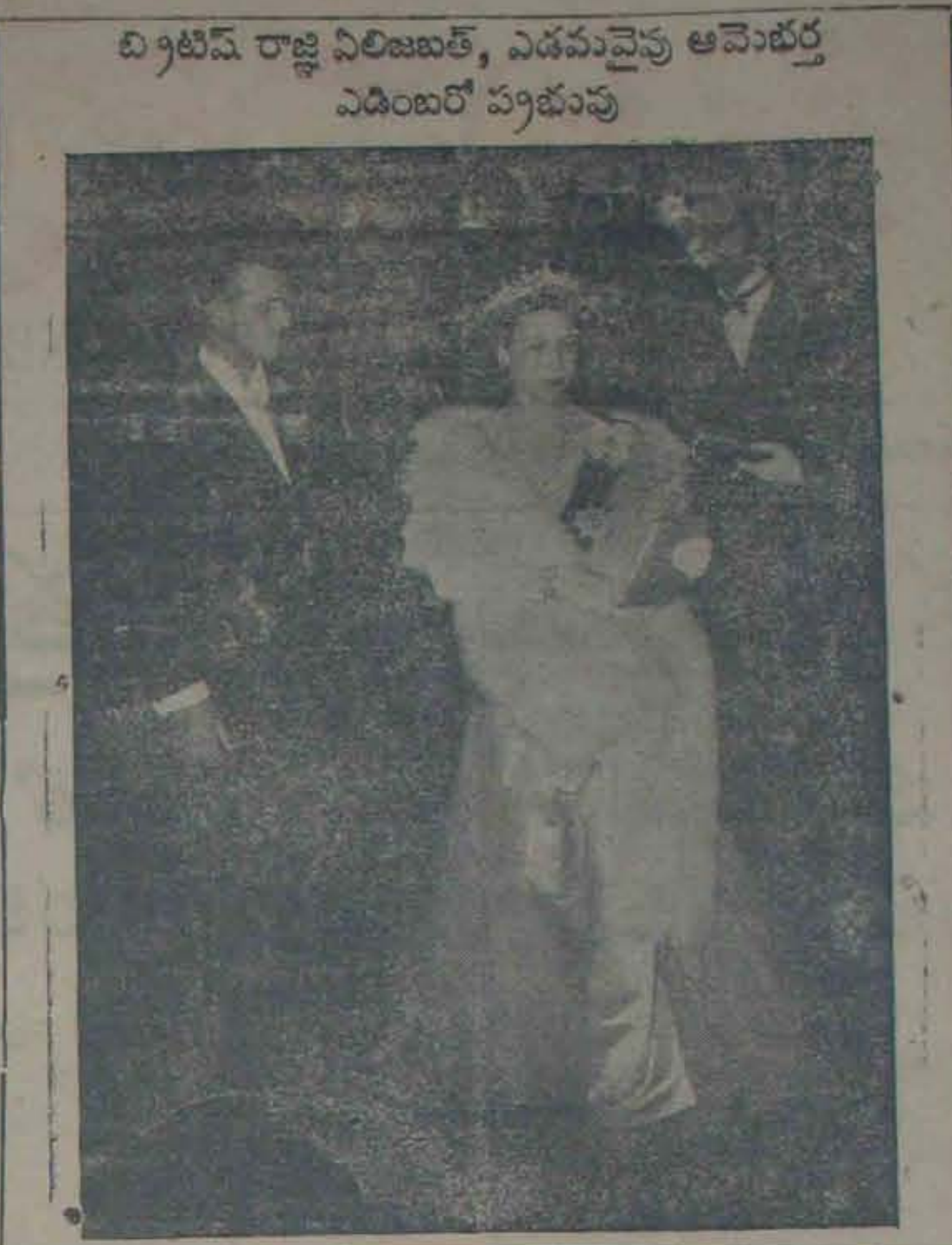
దిగ్గిటివే రాజ్ జి నిలిజబత్, ఎడమవైపు ఆమె భర్త ఎడింబరో ప్రభువు

మధ్యప్రాచ్యం అంటే, ఆరబ్బాబీయన్ల విస్తృత విజృంభణలను విశాలభూభాగంవలన, శతాబ్దులుగా ద్రిటిడ్, ఫ్రెంచి, స్పాన్, ఇటాలియన్, జర్మన్ సామ్రాజ్య వాదులచేత మర్చిపోతారు. మధ్య ఆసియా భూభాగం కొంత, ఉత్తర ఆఫ్రికా భూభాగం కొంత ఈ సామ్రాజ్యవాదీ గ్రూపుల ప్రభవంగా వుంది. అటు పశ్చిమాన మొరాకో మొదలు ఇటు తూర్పున పర్షియావరకున్న వివిధ దేశాలలో ఈ సామ్రాజ్య వాదుల పీఠాలు అనేక రూపాలలో పాడుకొని వున్నాయి.