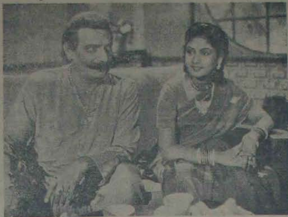
పనోదావారి 'కాంత్'లో ఒక సన్నివేశం

కాని తరుగుభోజనాలైన రాయలసీమ జిల్లాలలో, వి.వి.వి. మండలం ప్రాంతంలో పల్నాడు జూతు వేరక పరిస్థితి అధికంగా ఉన్నందున.