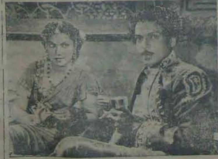
'అదృష్టం'లో కనకం పీఠాచార్యులు... ఏమిటి?

● మద్రాస్ కలర్ మెంటు ప్రచారకాళి కింద ఒక ఫిలిమ్ లైబ్రరీని స్థాపించడానికి మెద్రాస్ కలర్ మెంటు నిర్ణయించి కృషిని ప్రారంభించింది. 1200 చిత్రాలు యిప్పటికి సేరించారు. వాగద్య తియ్యగించి, ఒక్కావంతునించి, ఆరోగ్య గుంపించి చక్కగా పోధిస్తాయి ఈ చిత్రాలు గాన ప్రాధ్యూప విద్యా