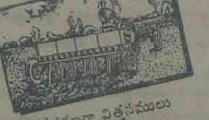
అతి వేగముగా విత్తనములు పట్టు యంత్రము

అద్దం • అదర్బయ్యలకు గొప్పమైనది, కచ్చిన రం, కచ్చిన అద్దం వ్యవసాయము వెలదు. 7300/-