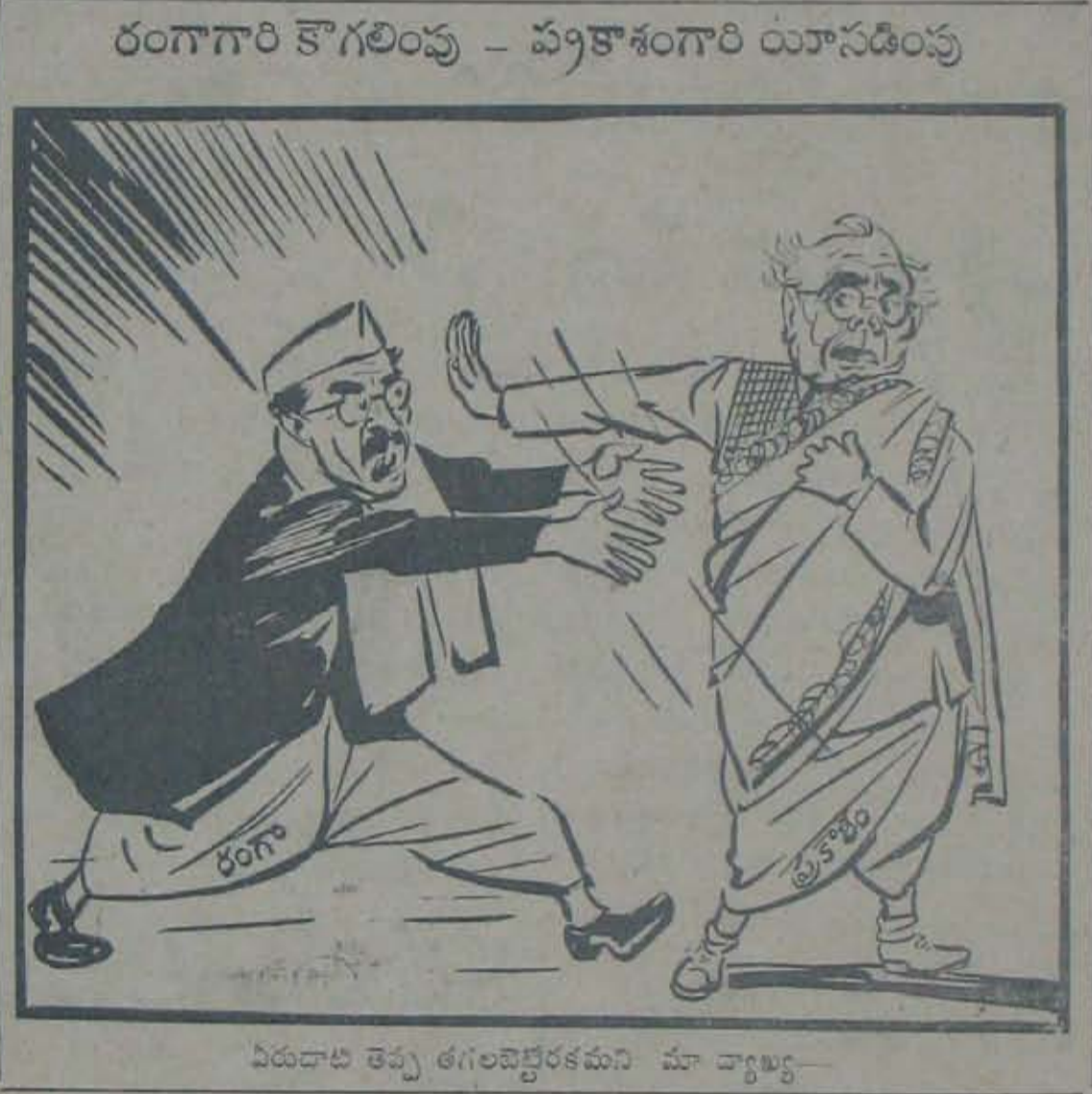
విరుదాటి తెప్ప తగలబెట్టేరకమని మా ద్వార్యులు. ఆంటూరు. ప్రకాశంగారు హెచ్చరించిన ఆశయ విభేదాలేమిటి? కంట్రోల్స్ - రైతు, కూలీలకు గూడ ప్రయోజనాలు.

చెకటి! కావున రంగాగారి రాజకీయ చరిత్ర నిరసనకు ఆశయ విభేదాలు మూలకారణంగాదని, కటికి అందని “స్వంత కారణాలే” మూలకని విశ్వసించవచ్చును. ఎంతగా అనుమానించబడినా రంగా కర్త