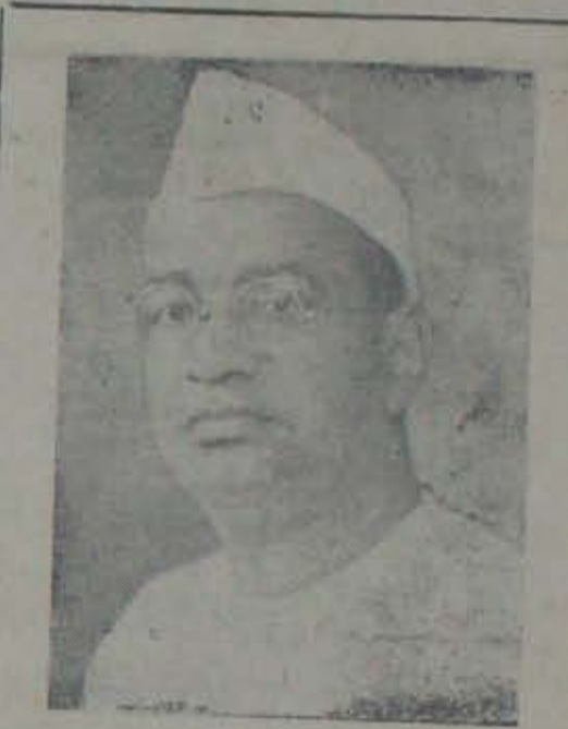
పైకిమారుడు ఆత్మకృషిచేసింది, పనిచేయుటకు కానున్న తూర్పు సమాజ ప్రధాని గోపీచంద్ భార్గవా

ప్రజాపార్టీ నాయకులు ప్రయత్నించుచున్న బహిరంగ సభలో ప్రజాపార్టీ నిధి కమిటీని ఏర్పరచుట ప్రయత్నములు చేయబడుతున్నాయి. ముఖ్యంగా చలపతిరావు తన బలములను ప్రయోగించుచున్నట్లు తెలియుచున్నట్లు డాక్టరు చలపతిరావుకు మద్దా