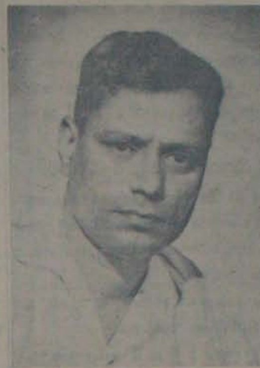
చిత్ర నిర్మాణమునూ మానుకోవచ్చు కానీ పాడుగు తగ్గించటం వీలుకాదు..... వాసన్, యస్. వాసన్.

బొంబాయిలో "మంగళ" చిత్రం విడదలకు కలిగిన ఆటంకంవల్ల, వాసన్ ప్రభుత్వానికి నోటీసిచ్చాడు