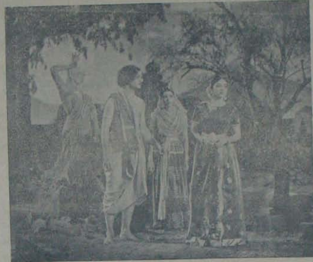
విజయనగర సామ్రాజ్య వైభవమును ప్రబలింపజేసే వాహినీవారి 'మల్లేశ్వరి'లో ఒకదృశ్యం.

మించగానే గుడిసెలో పోతు వైఖరేంటంటట! అంతట, ఆ గుడిసెలోనివాడే. యిప్పుడేక ఏమి చెయ్యడానికి చేయకదక, "ఆదుకు ల్రొక్కనేల కాలు కడకనేల" అని విస్తుపోతున్నాడు.