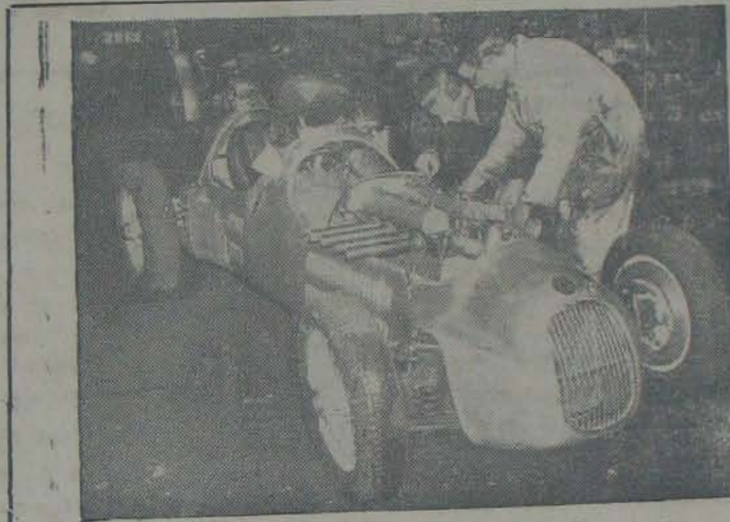
బ్రిటిష్ కేరళో తయారుచేయబడ్డ క్రొత్త కేసింగుకారు. కేసింగు క్రైవర్, మెకానిక్, ఇంజన్ను గురించి వివరించుకొంటున్నారు

దాగ ముక్కు. ముఖాన్నంతా ముక్కు-ప్రామి అయింగా ఆవరించిఉంది. ఏలంటే, కన్ను, కపోలము మొదలగు ఇతర అవయవములు తొంగి చూడడానికైతే వా ఛాన్ను ఉండేటట్టు కానుపించు. వాసికాగ్రమువలకు చప్పిడిగాదిగి తదుపరి ఉద్వేషమున ఇరువైపులకు విశేషంగా మెరుగుదల పొందిఉంది. ఇట్టిమహిమోపేతమైన వాసికావిశేషము వంశములో ఆంఠరించకుండా కాళ్ళతంకా నిల్వచెట్టాలనికావోలు, ప్రిన్సిపాల్లో విశేషాన్ని ఆసలుచెక్కు చెదరకుండా