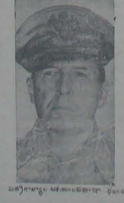
మెకార్లర్ బర్తరప్ ఆయినాడు-కాని యుద్ధంనూత్రం బర్తరప్ కాదు!