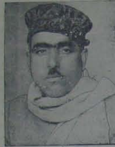
ఈ సోదానికి తోడుతున్న ముందుగానే యాంకెల్ ఫ్రెంచాకు 'కాల్టర్' కేసు జిల్లా.

ఆమెరికా పాకిస్తాన్ల మధ్య కొన్ని రహస్య బంధాలు ఉన్నాయి. అవి ఏమిట అని తెలుసుకోవడా ప్రతిభావయ. అవి ఏమిట అని తెలుసుకోవడా ప్రతిభావయ. అవి ఏమిట అని తెలుసుకోవడా ప్రతిభావయ.