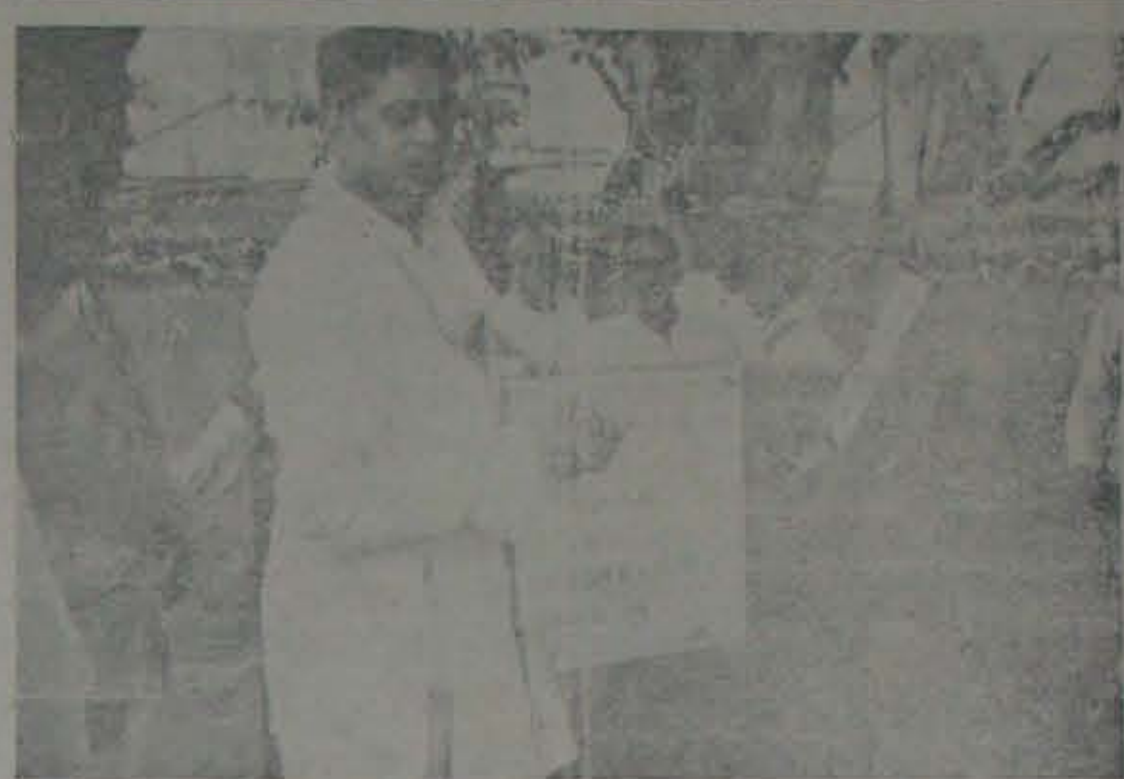
2-10-50 తేదీ నల్లూరు ప్రభుత్వం ద్వారా శ్రీ శ్రీ కళ్యాణ విద్యార్థులకు ప్రజాస్వామ్యం కోరుతున్నది.

—కాలక్షేప సమస్య పరిష్కారం కోసం ప్రజాస్వామ్యం కోరుతున్నది.