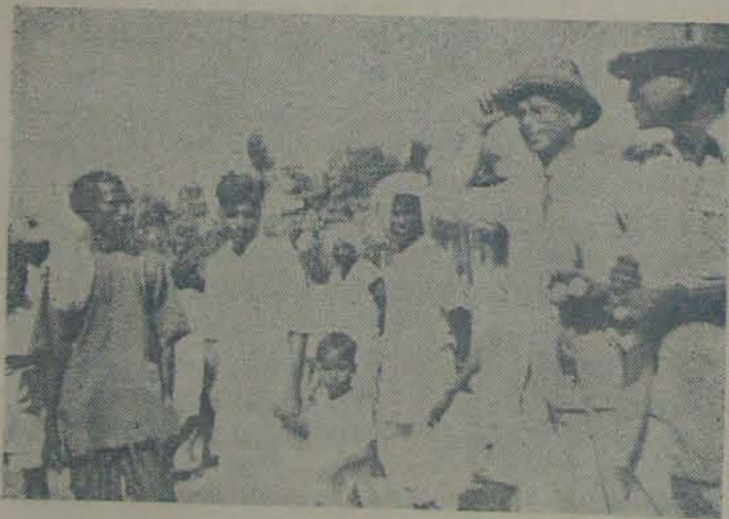
విజ్ఞానోత్సవం నెల్లూరులో కవలపండువుగా జరిగింది. కలెక్టరు, వారాయలూరు కలరి ఆధ్వర్యం వుత్సాహంగా ఏర్పాటు చేశారు. పేదల ఆస్తి దానం సందర్భంలో కలెక్టరు ఆనందిలో దీక్షా వారాయలు తలకిప్పున్నారు. శ్రీమం యీ సందర్భంలో ఏర్పాటుచేయబడ్డ పోటీసందాలు శిశుగానాడుతున్నాయి.