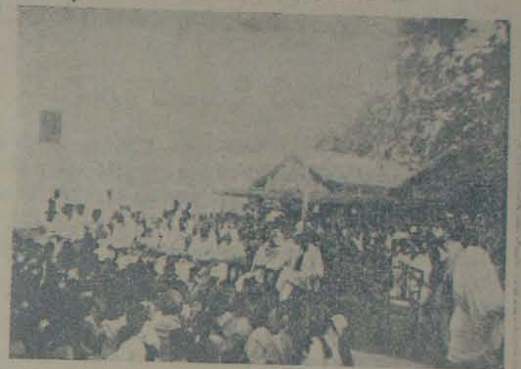
కస్తూరిదేవి బాలికాపాఠశాలలో జరిగిన కార్యదేయ నివృత్తవారిలోని వరుషులు. శ్రీ కలెక్టరు రామకృష్ణ, శ్రీమం పాలకా కవలము, కలెక్టరు సతీదేవి యంకా సరంబోని ప్రముఖుల కేటలాగ్విరి.