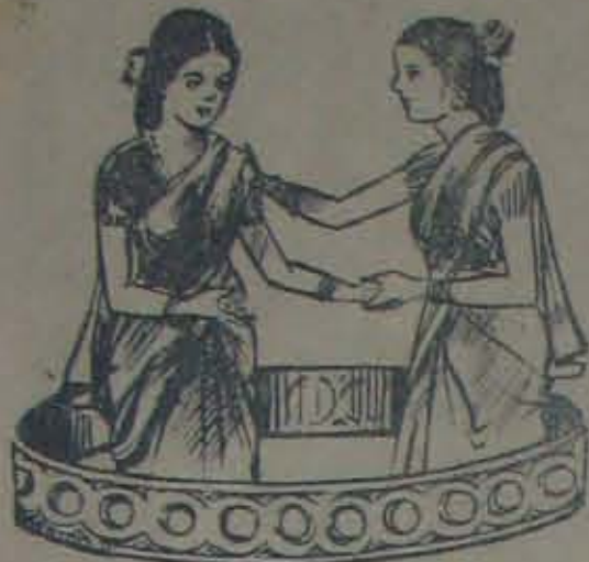
గుండం వెంకటయ్యారెడ్డి ఆంధ్ర చమ్మ వనలవర్ణము - తెల్లారు.

అందమైన యిందులోనే ఇమిడివున్నది ఎవరమ్మా తయారు చేసింది: