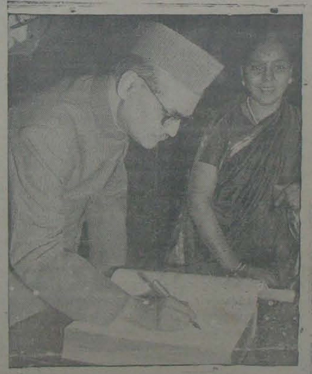
లిటివ్ పార్టీమెంట్లు మార్క్సిస్టులకు ప్రార్థనకోర్కెవారికి హాజరైన భారతదర్శి మెంటు స్పీకరు, కంట్రీవోల్ వినియోగదర్శిలో విజయవల్ల ప్రవచనం అంధ్రులకు చెబుతున్నాడు. ప్రక్కనే వారిసహాయకులు.

ఇటీవల గుంటూరు జిల్లాలలో రాజకీయ బాధితుల లిస్టునుండి 25% కేటాయింపు జరిగినది, వారందరూ పునర్నివారణచేయాలని చెప్పిన రాయబారంపెట్టాడా ఏమీ సమకూడలేదని, తొందరచేయబడిన కేటాయింపు సుమాదు రాష్ట్రకాంగ్రెసు వర్గానికి చెందినవారని అంటారు. మిగతా జిల్లాలలో మంత్రివర్గం ముఖావారికే ధూములు మంజూరు అయినానే నేరమాకోపించబడినట్లు విన్నాం. కాని గుంటూరు జిల్లాలో జరిగిన విషయం ప్రత్యేకత. పోతే యీ జిల్లాలో చేతుతోనిచేసిన కారణం తెనాలి మహాసభలో తెలిసింది. వీరు తప్పక స్పర్ధి కేటాయిచ్చారంటే గాడు వ్యతిరేకత వ్యక్తం వారి విభూములు తొందరయిస్తారనే పరస్పర నిందాకోపాలు. కాణం ముఖా ప్రాబల్యమే కదా! ఈ రాజకీయయోధుల మహాసభకూడా ఏ దృష్టితో జోషాలో తెలుస్తుంది.