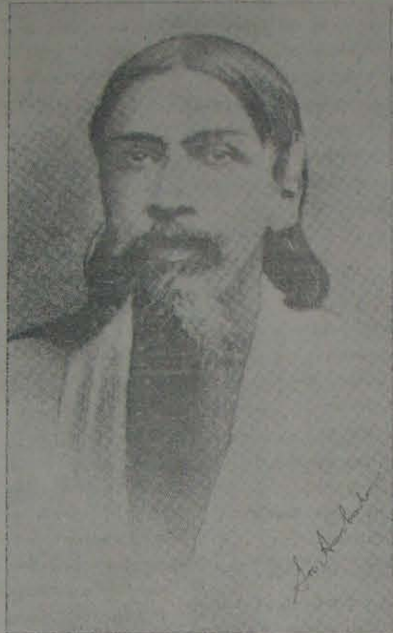
అమరజీవి శ్రీ అరవిందులు