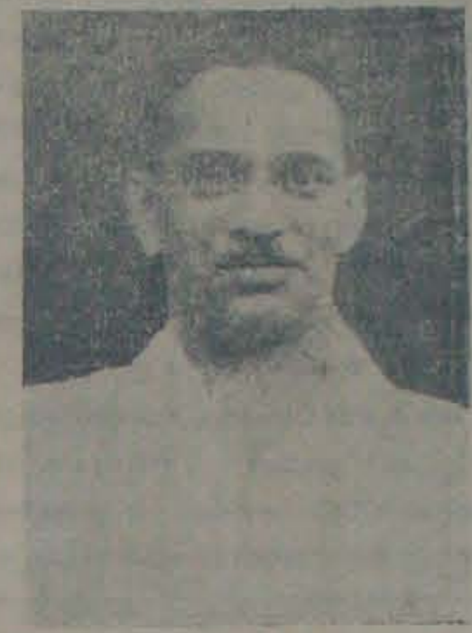
అభ్యుదయ కమిటీ కార్యకర్తలలో ఒకరు.

కృష్ణా జిల్లా పర్యటన పూర్తి అయిన పశ్చిమ కృష్ణా జిల్లా కాంగ్రెసు సంఘం ముఖ్యమంత్రికి నివేదికను సమర్పించింది. ఈ సమస్యనూ, పరిష్కార మార్గాలనూ స్పష్టంగానూ చిత్రించారు. కాంగ్రెస్ సేవార్లను నిర్మించాలని, ఆయుధాలను యిచ్చి వాటిని పునయోగించడంలో తగ్గించువ్వాలని, పోలీసులు గ్రామాలపై దాడి జరపటాన్ని సానిక కాంగ్రెసు సంఘాల సహకారంతోనుకోవడం, కాంగ్రెసును, మంత్రివర్గమును ఆపగొట్టే పాలుచేసి