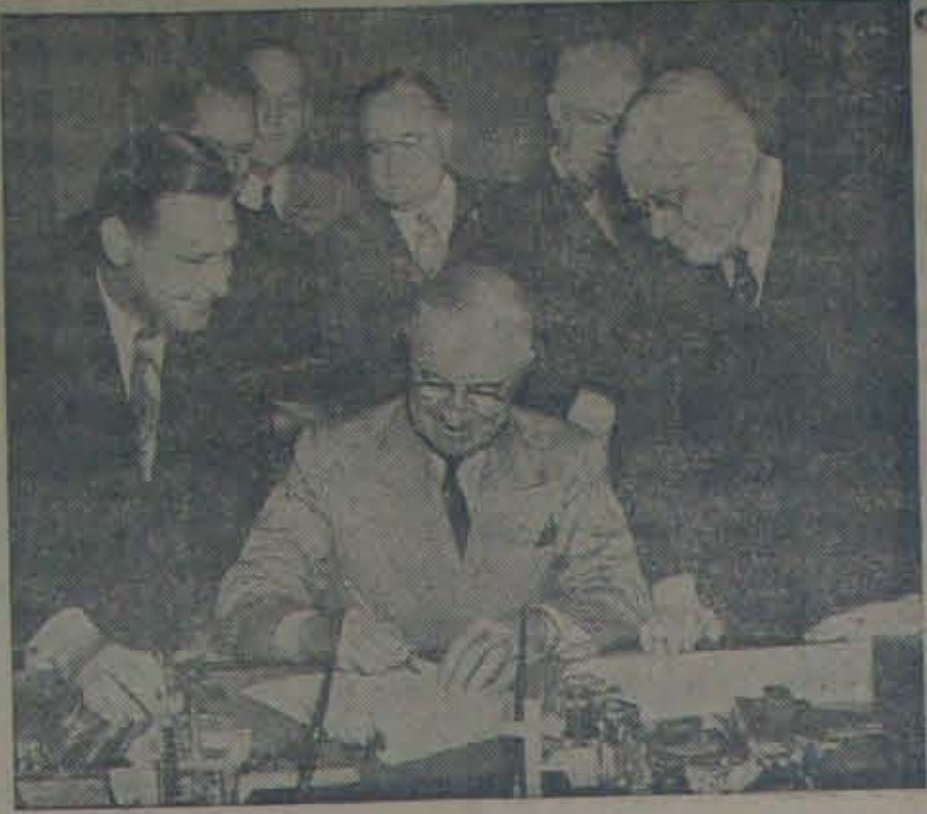
ఆమెరికా అధ్యక్షుడుగా ఆరోసంవత్సరం గడుపుతున్నాడు రిలీ సంవత్సరాల దృఢకాయుడు ట్రూమన్.