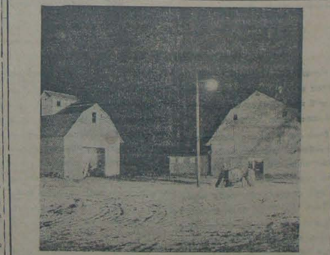
ఆమెరికాలో దాదాపు ఏదింట నాలుగు వంతుల రైతాంగానికి, ఆత్మంక చాకగా ఎలక్ట్రిసిటీ సౌకర్యం ప్రభుత్వం కలుగలేదని. దీనిమూలంగా రాత్రిపూట పనులు యయకుగా జరగ మేగాక, అనునిత వ్యవసాయ యంత్రాల మయోగించడంలో వున్న తగ్గి అధికమాటకు ఆవకాశం కల్గింది. ఈ సందర్భంలో రాత్రిపూట విద్యుచ్ఛక్తి సహాయంతో నేద్యపుపనులు సాగించుకోవడం చూడవగును.

డిసంబరునుండి యిప్పటి వరకు కమ్యూనిస్టు రాక్షస చర్యల వల్ల కల్గిన నష్టం