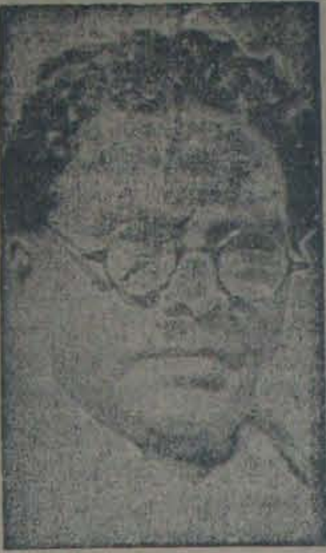
మంతులమీద ఫిర్యాదులు తాను వదులు కోవనీ, సుక్రీంకోర్టు దా తా యిడుస్తా వంటున్నాడు.

కల్పించ బడింది. ఈ కొత్త సదుపాయాలే ఎంతో వుపకారం కాగలవనీ, రెండు దేశాలలోని మైనారిటీల సమస్య పరిష్కారానికి యిది మంచి అవకాశాన్ని కల్పించవచ్చునని మా అభిప్రాయం.