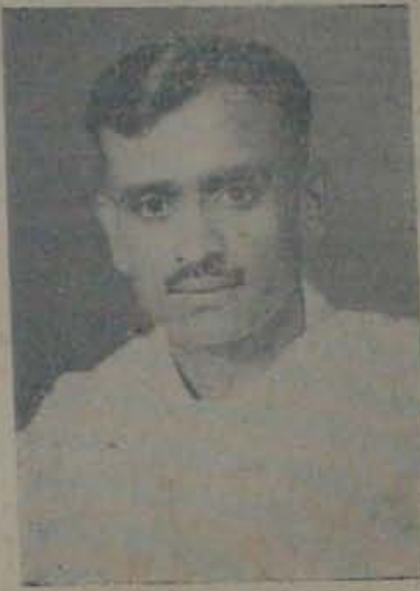
మంత్రి శ్రీ నీలం సంజీవరెడ్డి

“ప్రభుత్వం ఎంతవెచ్చటికైనా, ఇప్పుడు కావల సినంతవరకు తీచడలేదు. చిన్న చిన్న ప్రాంతాల్లో కట్టించడానికే ఇంజనీర్లు ఉన్నారంటే, 5, 6 ఏండ్లయితే తప్ప సదుపా యాలు ఏర్పడవు. దీన్ని సంపాదించడం సులభమే కావచ్చుగానీ ఏర్పాటు చేయడమే కష్టం. కష్ట లను గుర్తించి ప్రభుత్వం ఎదుర్కోవలసి, ఫలి తాన్ని ఆక్షేపించకుండా పాటుపడితే తేలికగా పడి పునఃసంస్థాపన వచ్చుతుంది. ఇందుకు మొదటి మెట్టు పంచాయితీలు. కల్లూరిని కట్టుకు మరచి