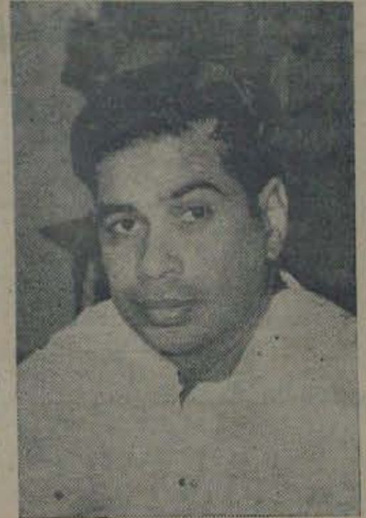
మన ఆర్థిక మంత్రి

మద్రాసు ప్రభుత్వానికి 1948-49 సం॥ బడ్జెట్ ప్రకారం మొత్తం వరుసది రూ 58. కోట్ల 38 లక్షలు మొత్తం వ్యయం రూ 57 కోట్ల 4 లక్షలు లాటు రూ 3 కోట్ల 65 లక్షలు. వైఖాటును నిర్వహించుచున్నది, కొత్త పన్నులతోనే సమర్థించాలి. 49-50 సం॥పు బడ్జెట్ అంచనాలు మొత్తం వరుసది రూ 51 కోట్ల 75 లక్షలు మొత్తం వ్యయం 55 కోట్ల 86 లక్షలు లాటు 28 కోట్ల 90 లక్షలు. వైఖాటును నిర్వహించుచున్నది, కొత్త పన్నులతోనే సమర్థించాలి. 49-50 సం॥పు బడ్జెట్ అంచనాలు మొత్తం వరుసది రూ 51 కోట్ల 75 లక్షలు మొత్తం వ్యయం 55 కోట్ల 86 లక్షలు లాటు 28 కోట్ల 90 లక్షలు. వైఖాటును నిర్వహించుచున్నది, కొత్త పన్నులతోనే సమర్థించాలి.