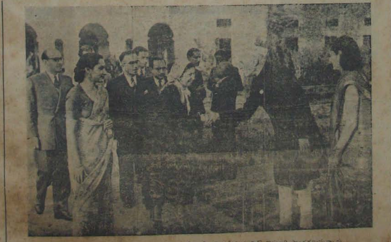
అనియత రాజ్యాం మహానవికొచ్చిన సరియన దిలగితే మేడమ్ కక్కిక వందీక నెహ్రూ ప్రాగ్ జనాభా

మీరు నిజముగనుకని మారినవందం. యుద్ధంలో చర్చిలో మహాశయనిక బ్రిటిష్ ప్రజల ప్రహార్యం పట్టించి. యుద్ధానంతరం ఆయనను నిర్దాక్షిణ్యంగా రిఫంబుడిగించి, నిజాయితీ గల సచివోత్తముని ఎన్నుకొన్న బ్రిటిష్ ప్రజలలో గాంధీ దేదీప్యమానమై వున్నాడు-నీలోకంటే, నాలోకంటే. నాయకులను గౌరవించేవిధంగానూ మనకు —కొరవ 8 పేజీలో.