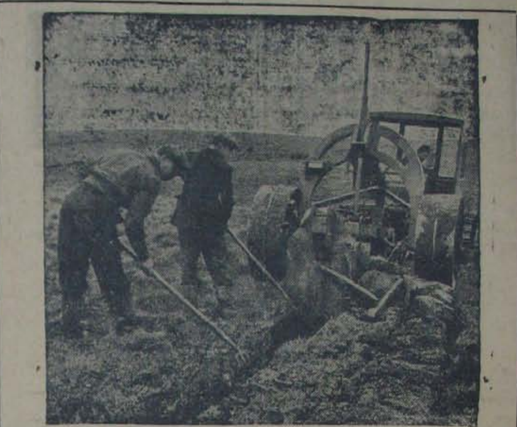
ఉత్పత్తి, ఉత్పత్తి, ఉత్పత్తి, ప్రపంచంలో ఏమూలయాలినా యిదే వివాదం. బ్రిటిష్ కాలంలో గౌర్యలనుమేసే పచ్చికబయళ్లునుగూడా పంటపొలాలగా మార్చివేస్తున్నారట. ఈచిత్రం ఆదే మాత్రమేస్తుంది.

క్రామికులలో క్రామికుడైనప్పటికీ రైతు యిప్పటివరకు సర్వస్వతంత్రుడుగా వ్యవహరిస్తు వ్నాడు. రాజులు మారవచ్చు, పరిపాలన తల క్రిందులుకావచ్చుకాని రైతు స్వతంత్రుడుగానిల్లి