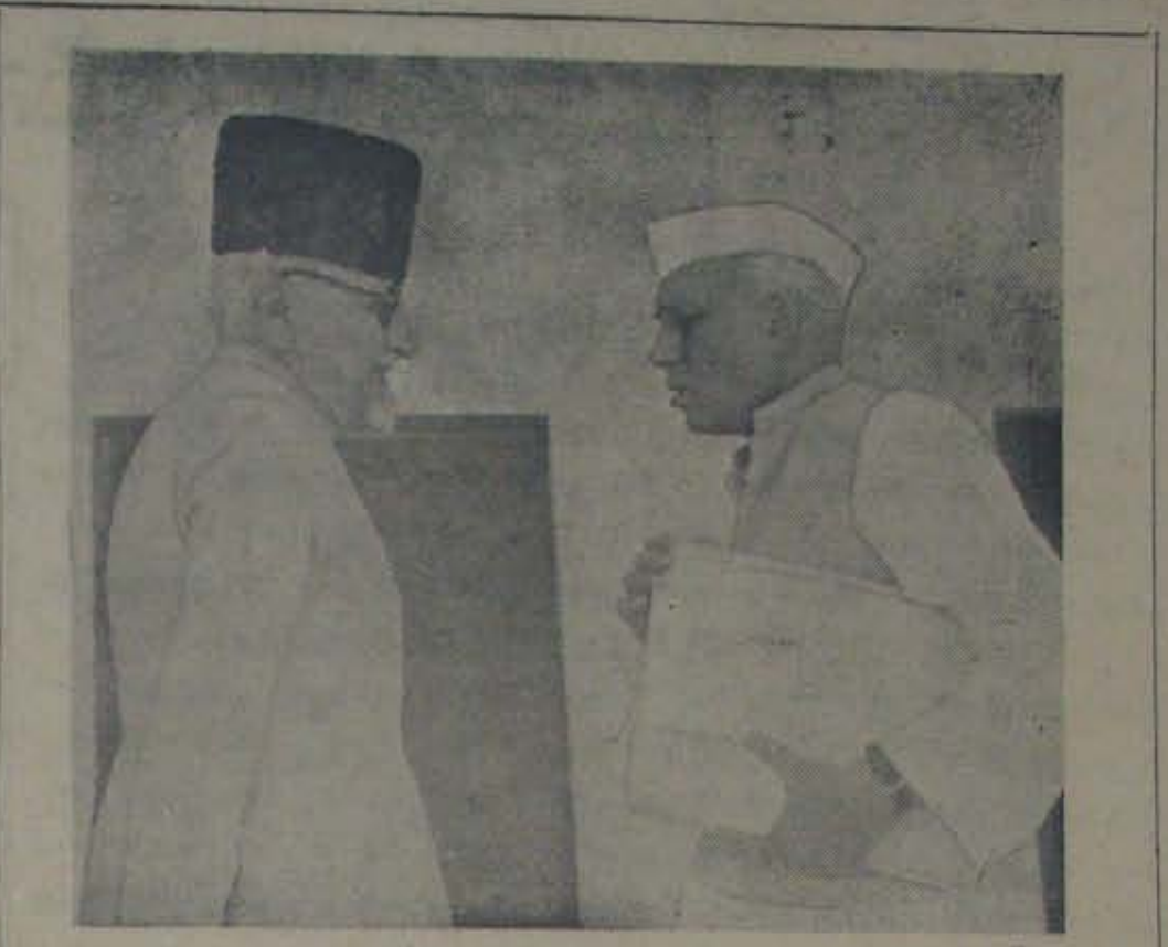
అబ్దు: ఎంత చిక్కుప్రశ్న: కాంగ్రెస్ కార్యవర్గ సమావేశం అయిపోయి వెలుపలికొచ్చినతెర్రార్లగుడా పండిట్ సహస్రీ, మాలానా అబ్దుల్ కలామ్ ఆజాద్లు ఏదోముఖ్యమైన సమస్యను చర్చిస్తున్నారు.