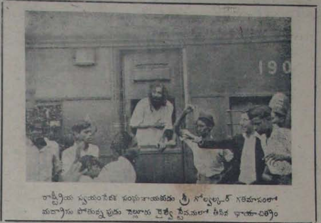
రాష్ట్రీయ స్వయంసేవక సంఘసభకు శ్రీ గోల్కల్కర్ గౌరవసంతా మద్రాసు పోతున్నప్పుడు నెల్లూరు కైల్వే స్టేషనులో తీసిన ఫోటో

సంపుటి 20 సంపాదకుడు: సంపుటి 33 నెల్లూరు వెంకట్రామానాయుడు