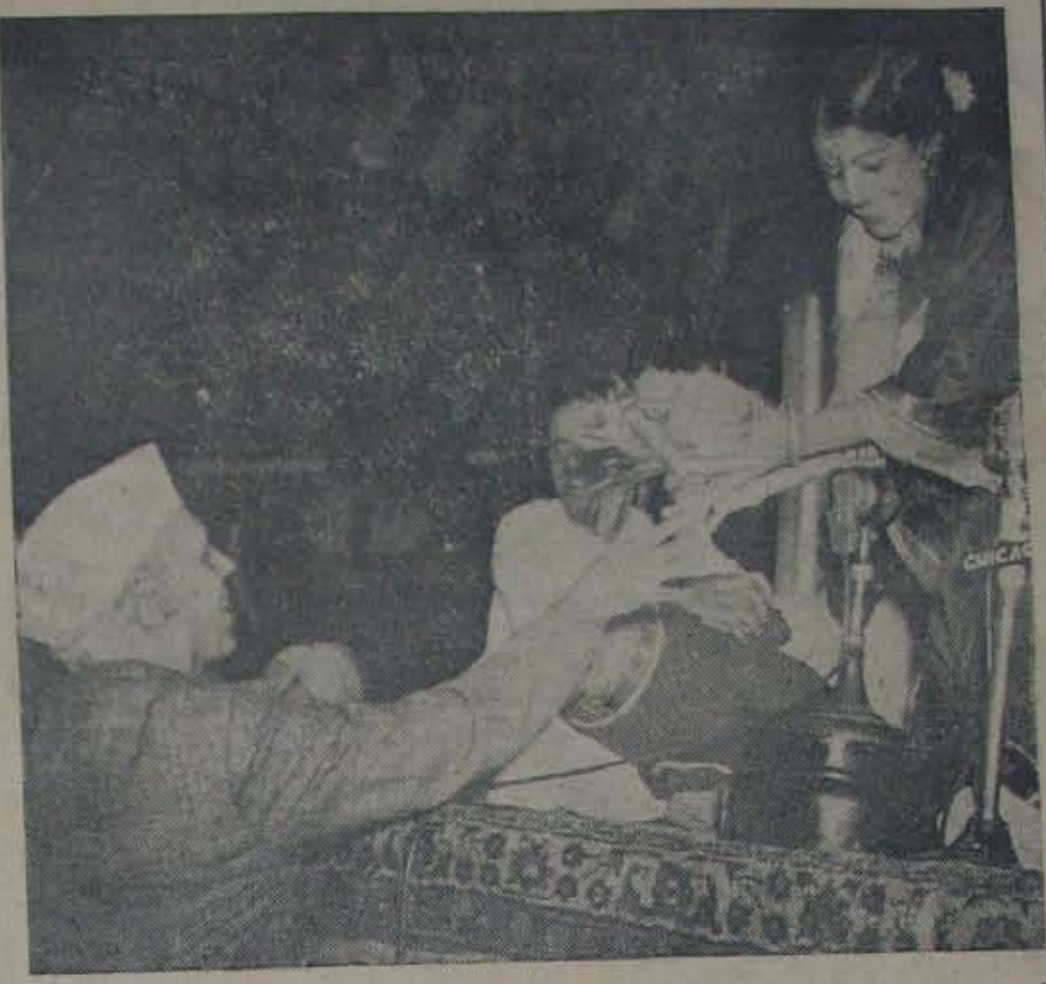
మద్రాస్ ఎడ్యుకేషన్ అసోసియేషన్ వాయిస్ వెకండరీస్కూలు సహాయార్థం, 18 వం 27 తేదీ ఢిల్లీలో పృథాని పండిట్ నెహ్రూ అధ్యక్ష్యంకింద శ్రీమత యం. యస్. సుబ్బలక్ష్మి పాట కచ్చేరి జరిగింది. ఆమె గావనుభలో తనవయస్సైన బహుళ దరహా సవదనతో పునవగుచ్చాన్ని అందిస్తున్నాడు.