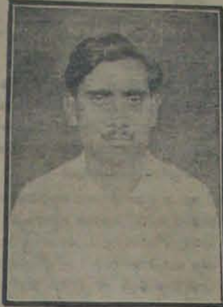
శ్రీ జక్కా వేంకటేశ్వరుడు