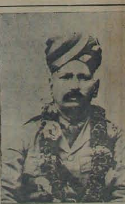
స్వర్ణీను తె. కో. చిక్కలరావునాయుడుగారు మరణం 10-6-48

ధాన్యం ఒక గంపాను తెనల్లో ఎక్కడా గానూ పోకున్నందున పుట్టిపుకార్ నెల్లూరుకు చీమ లాగుచలె పోకున్నది. కానీ 280 వరుకు లేలు వున్నందున. సర్ప్లస్ లాగాకాల రెండీ అన్ని వైపులా పుట్టుపడి గింకలకుండా కారిపోకున్నది. వెనుక ముందు యింకా కలిపి వరుకులేదు. శింగాలు కలిపి ముందు లాగాకాలి యింకా వరుకులే గింక లేకుండాపోయి వెనుక నల్లలమోడినట్లు చూడీ చరి తోషివచ్చి రెక్కినాయి. కానీ ముందు తోషారకు వహించండి.