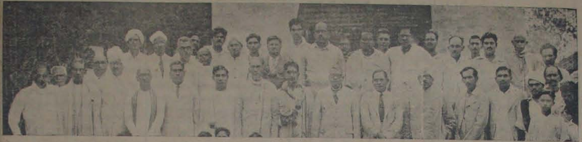
కోవూరు బోర్డు హైస్కూలు ప్రారంభోత్సవ సందర్భమున హాజరైన ప్రముఖుల చాయాచిత్రం.