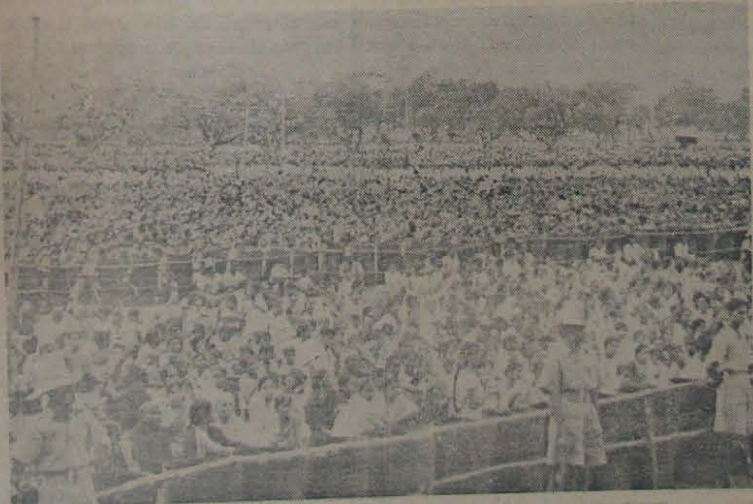
షెడ్యూలులో పండిట్ జవహర్ లాల్ నెహ్రూ ప్రాసంగిక వేదికను ఏర్పాటు చేసినందుకు రెండు దినములుగా వారి.