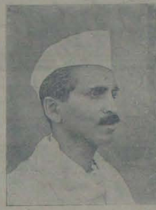
గుణపాలానెన్నో వున్నది. క్రమంకరమైన, దననం పన్నుపైవారి సంస్థలు, న హా కార వర్ధకుం

కష్టపరమైన, వ్యవసాయమైన మనదేశంలోని వ్యవసాయాన్నిగూర్చి, మనరైతులకు విశ్రాంతి లేక పోవడాన్నిగూర్చి మీరు విచారించవారు. ఈ దేశం లోని వ్యవసాయాన్నిచూచి మనం నేర్చుకోవలసిన