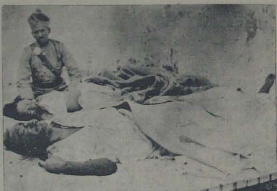
హైదరాబాద్ లోని సూర్యపేటలో, రాత్రి లో జనానంకరం నిద్రించుచుండిన మూర్తి ఆయన భార్యను, ముస్లింలచేత అచ్యుత సబ్ యికా స్పెక్టర్ ప్రోత్సాహంతో క్లారోఫారం యిచ్చి దారుణంగా పడకమీదనే చిత్రవధ చేసినప్పటి దృశ్యం

ఇండియాన్ యూనియన్ లోకి చేరడం, తూర్పుబెంగాల్ (యండియాన్ యూనియన్ లోవిడి) లోని ముస్లిముల పాకిస్తాన్ కు - వంశం - మొదలగు - కలలోగూడా పూహించు - జనాభాచూర్చి, కరణాధ్యక్షులకవనకుం చేకూర్చడంలో సరిపోయింది పాకిస్తాన్ వంశాద్ నుండి ముస్లిమేతరంవలన సురక్షితంగా యండియా చేరుకున్నారనే చెప్పవచ్చు. వర్షపు నీటిలోనుండి హిందువులు, కిబ్లాలు కాలినదాన లక్షలమంది, భారత నైజంకం పహారో, రక్షణకో యండియాన్ యూనియన్ కు చేరుకున్నారు. మరోనూరు ప్రజలను నణలుతుకు, అత్తలకు సరియైన ఏర్పాట్లచేయటకు పాకిస్తాన్ మంత్రులు, భారతమంత్రులుగూడా రెండు సార్లు సమావేశాలు జరిపిన హత్యకాండకు కారణమైన వారిపై నిర్ణయించి చట్టం తీసుకొనుటకు పర్ష యింటుకొన్నారు. యంతవరకుదాగున్నదిగాని, యిండియాన్ యూనియన్ లో ముస్లిముల హత్యకాండ మాన్యకపోతే మిత్ర రాజ్యనమితికి చిక్కాడు చేయవలసి వస్తుందని, అది చివరమైతే ప్రత్యేక దర్జంకు నూనుకోవలసి వస్తుందనే వర్ జప్రల్లా(అమెరికాకు పాకిస్తాన్ రాయబారి) గడుసుడనపు ప్రకటన, యిండియా తమపల్ల కర్మకాన్షి వహిస్తున్నదని, తమ వివాదాన్ని అది ఒకీస్తున్నదని పాకిస్తాన్ ప్రవాసి రియాల్ట్ భార్యభారహిత అసంబద్ధమై ప్రకటన అందరకు విన్నయాన్నే గాకుండా, పుర్రెకామ్మిగుదాల్ యగ్ జేస్తున్నాయి, మతముపేరకు జరుగుతున్న దారుణ హత్యకాండ నిరీకల్పడంలో వారి నిజాయితీని కంకించవలసి వస్తుంది. కానీ ప్రై ప్రకటనకు భారత ప్రభుత్వ జవాబుండవలసింది, భారత రాజ్యాంగ సరిష్కర్ ముస్లింపాక్షిణాయుకుడు చొదరీ ఖలిఖజ్మాన్,