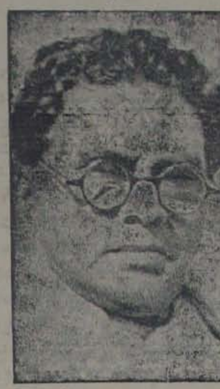
శ్రీ బంగుటూరి ప్రకాశం

మద్రాస్ నగరాన్ని ఆంధ్రంకూ, తమిళనాడుకూ "తమదే" అంటున్నాడు. ఈ విషయంలో తర్రుపికి రాష్ట్రం అవసరం, చారిత్రకంగా, ఇతర విధేషాదు. దివరకు జనాభాభట్టకూ ఈ విషయాన్ని నిర్ణయించవలసివుంటుంది. సరిహద్దు నిర్ణయక సంకుచితా అన్ని విషయాలను కాంగ్రెసుకొక పరిష్కరించుకోవచ్చు. త్వరలో మన రాష్ట్రం యేర్పడగలరని ఆశిస్తున్నాము.