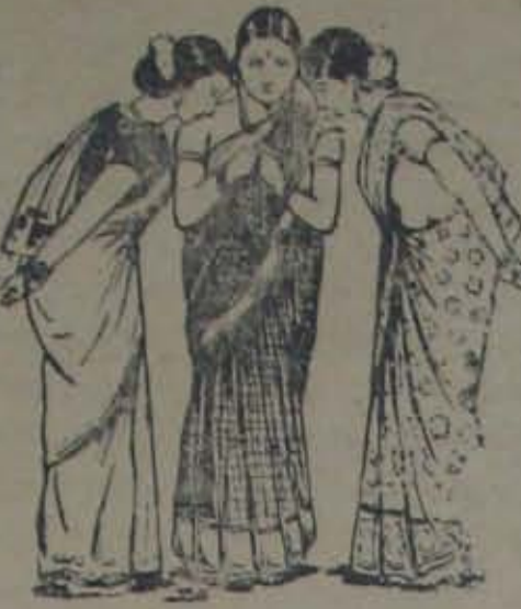
గుండాల చెంకటసుబ్బారెడ్డి & సన్లు సంపత్కరులు - నెల్లూరు.