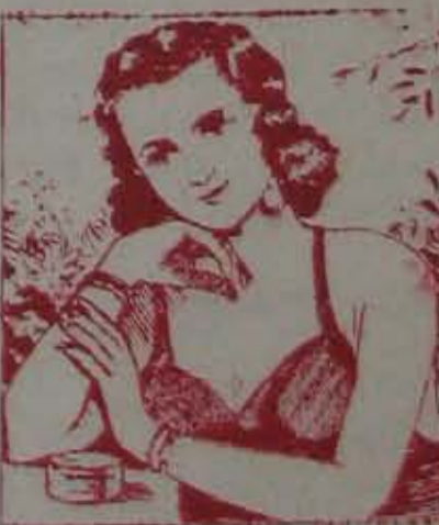
సుబ్బారావు పేట, నెల్లూరు