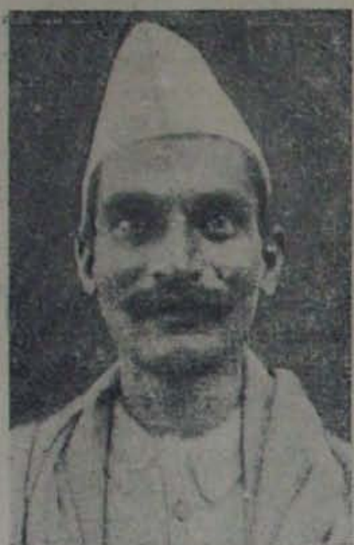
భారత రాజేంద్ర ప్రసాద్