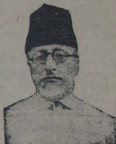
మౌలానా అబ్దుల్ కలాం అజాద్

ఇవి వివేచిత వర్షాల దేశంలో ఏర్పడటాన్ని అవి ప్రజల హింస చేసేవలననే 'గోదామిట్ల పై రోజుల్లో' వందల అక్షరాల వలన వారు బాగా వర్షాలకు ఉన్నాయి. వరదల మూలంగా అనేక ప్రాంతాలు వీటిలో మునిగిపోయాయి. పెళ్లూర్లో వరిపంటకు అధిక నష్టం ఏర్పడింది. కొన్ని చోట్ల పంటలు ములలో పడినవి గురి ఎత్తిన వీరు నిర్వియమిట్ల వార్షిక చేరుచున్నవి అంది. బెడవల మధ్యలెత్తి, వలచోట్లకు బియ్యం రాకపోవడం స్థానిక ప్రజలను అనేక ప్రదేశాల్లో దాడుల వల్ల పాపం వల్ల ఇబ్బందిలోకి నెట్టేసినట్లు వేంకొండ ప్రజలు దుర్భర పరిస్థితులకు గురియగుచున్నారు. కొన్ని చోట్ల యితరమును తెన్నులు కుదవనంతటివరకు