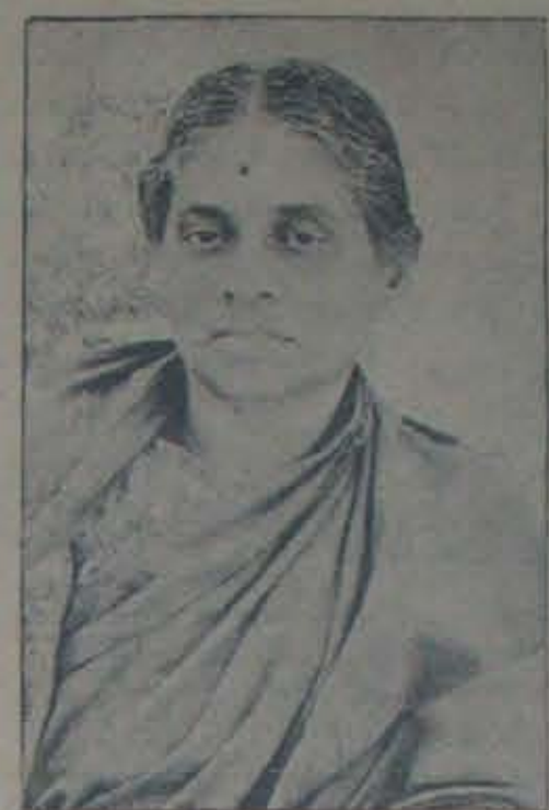
ఏట 8-10-48 లేడి నెల్లూకులో జరిగిన ఆంధ్ర రాష్ట్ర కాంగ్రెస్ మహిళాసభకు అధ్యక్షత వహించి, ఆంధ్రనారీకాన్ని రాజకీయ త్యాగిణ్యంలోకి అహ్వనించి కాంగ్రెస్ కులానికి కీర్తిప్రతిష్ఠలు తెచ్చిన ఆంధ్ర లేడోమూర్తి. ఏట తనవ్యాసం కి వ చేతిలో దూడనగును.

ముస్లింకూటుంబం తారీయ సభాకమ అధిష్టంకో ఏ/రవేకాదు.