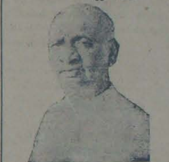
పార్లర్ వల్లనాయి పాలేర్.

"అధ్యక్షులుగా ఆయన పూర్తిగా గాంధీ జీవితమును, నిర్వాహకత ఆయనలో మూర్తీకరమైంది. దారదేశ జాతీయోద్యమ స్పర్షితో అత్యంత ప్రధాన పాత్రను నిర్వహించాడు. దారదేశ స్వాతంత్ర్య సమరంలో అతరుడు" (ముస్లి)