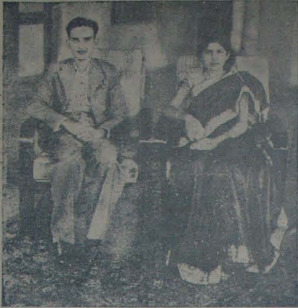
24-5-45 తేది వివాహమైన వధూవరులు.