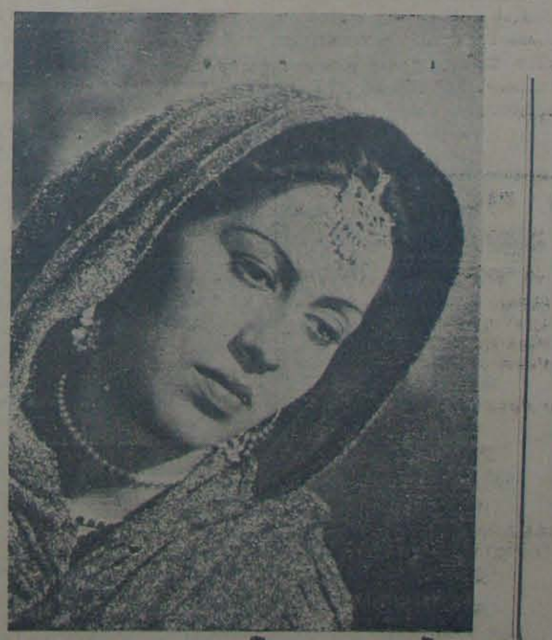
"ప్రభుత్వం" లో నిర్ణయం

(5) విదేశీయ పాఠశాలలను వివరించండి. మి పార్టీ పాఠశాలలను వివరించండి.