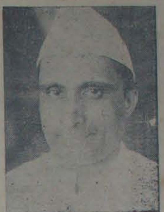
యన్.కె. పాటిల్ (కాంగ్రెస్ కాంగ్రెస్ నాయకులు.)

'జమీన్ రైతు' ఆంధ్ర జాతీయ వారపత్రిక ప్రత్యేక కాంగ్రెసు సంచికను వెల్లూరు వెళ్ళింది. ఈ ప్రయత్నం అన్ని విధముల బయట ప్రచురుగుతూ రక్షణ భారతంలో కాంగ్రెస్ కార్యక్రమాన్ని ఉత్సాహంతో కొనసాగించుటలో ఇది తోడ్పడును నా విశ్వాసం.