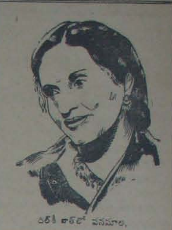
దిలీ కలలో వనమాల.