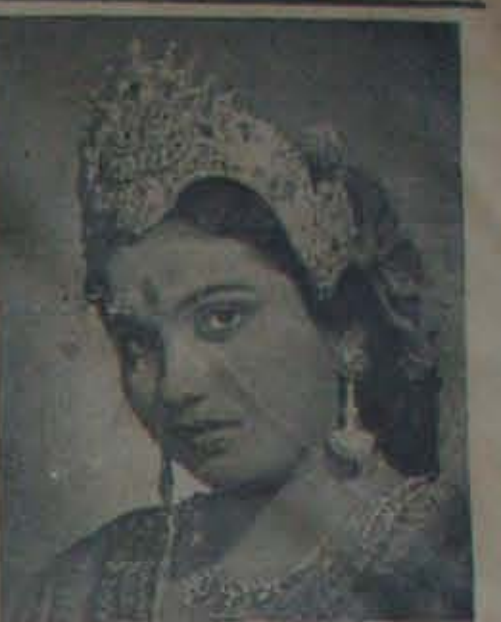
అందరందాడు, నాట్యరతులకు తెలుగు జాతిపై గాక దక్షిణ దారతముసంకా ఉద్రావయాలించిన అందరికై