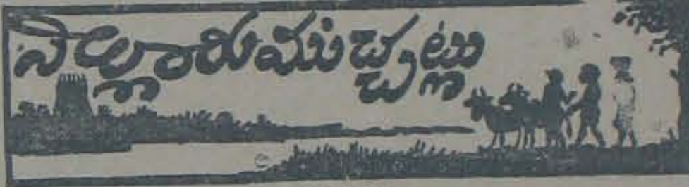
— విచారకుడు —

వైస్రాయ్, వైబురి పనిపేరీ రంగాలలో తెప్ప కొట్టగ విశేషాలులేవు, ఇటు ఈ వారిలో కార్న్ బబార్ పైకి ఆపా విమానాలు వచ్చాయి.