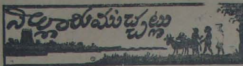
— వినుకపాడు —