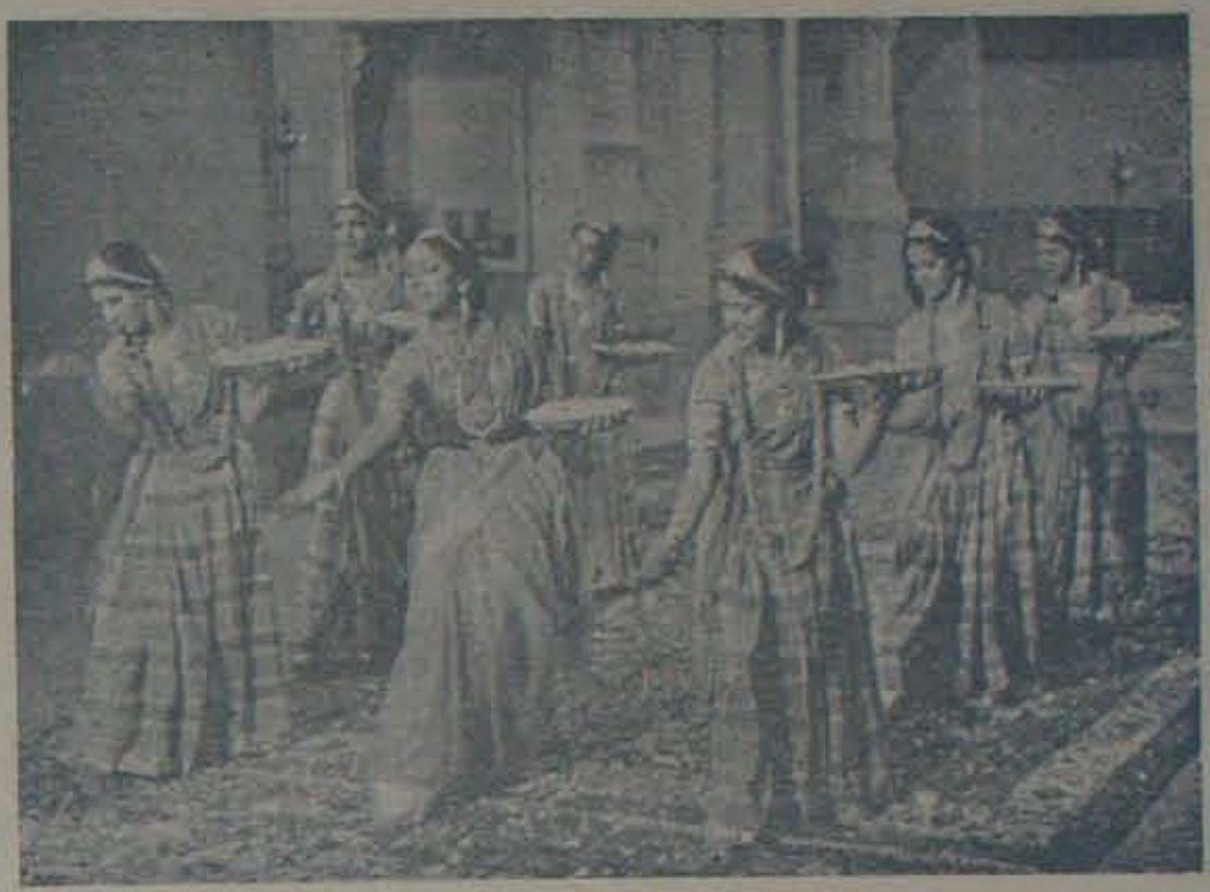
వాహినీవారి 'పోతన'లో సరస్వతీభా.

సామ్రాజ్యవాదం భారతదేశాన్ని లంబకేశంగా తన్నుక ఉంచుకోవాలని, తన పెట్టుబడిని ఎగుమతి చేసుకోవాలని కోరుతుంది. అంచేత, ఇండియాలో కాపిటలిజం ఆభివృద్ధిచెందనండా సామ్రాజ్యవాదం ఆరికట్టుతుంది. సామ్రాజ్యవ్యవస్థయంతో రైతులను దోపిడిచేస్తుంది. అంచేత