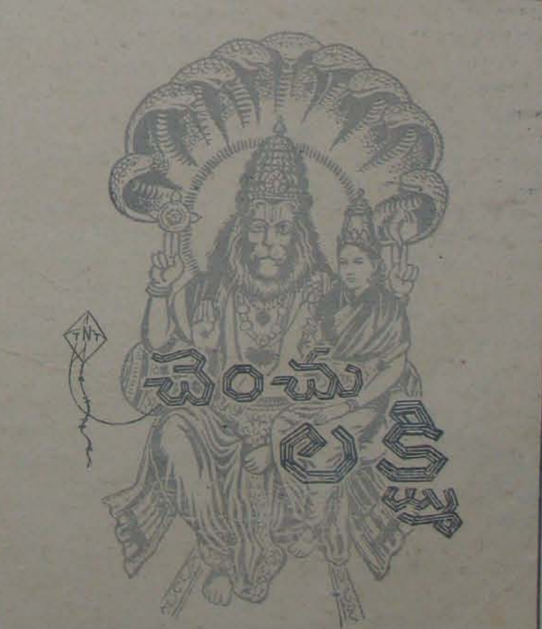
న్యూటోన్ స్టూడియోలో తయారౌతూంది.